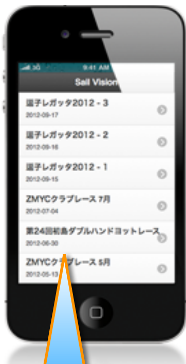
レースチェックイン画面

スマートフォンのGPS機能を使い、ヨットレースの状況をリアルタイムで見ることが出来ます。運営艇・参加艇は現在地の緯度経度情報をサーバーに送るため、iPhoneもしくはAndroidスマホが必要です。(アプリをダウンロードする必要があります。) なお、レース状況を観覧するにはパソコンやスマホなどのwebブラウザで可能です。