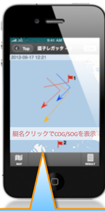
レース中マップ表示